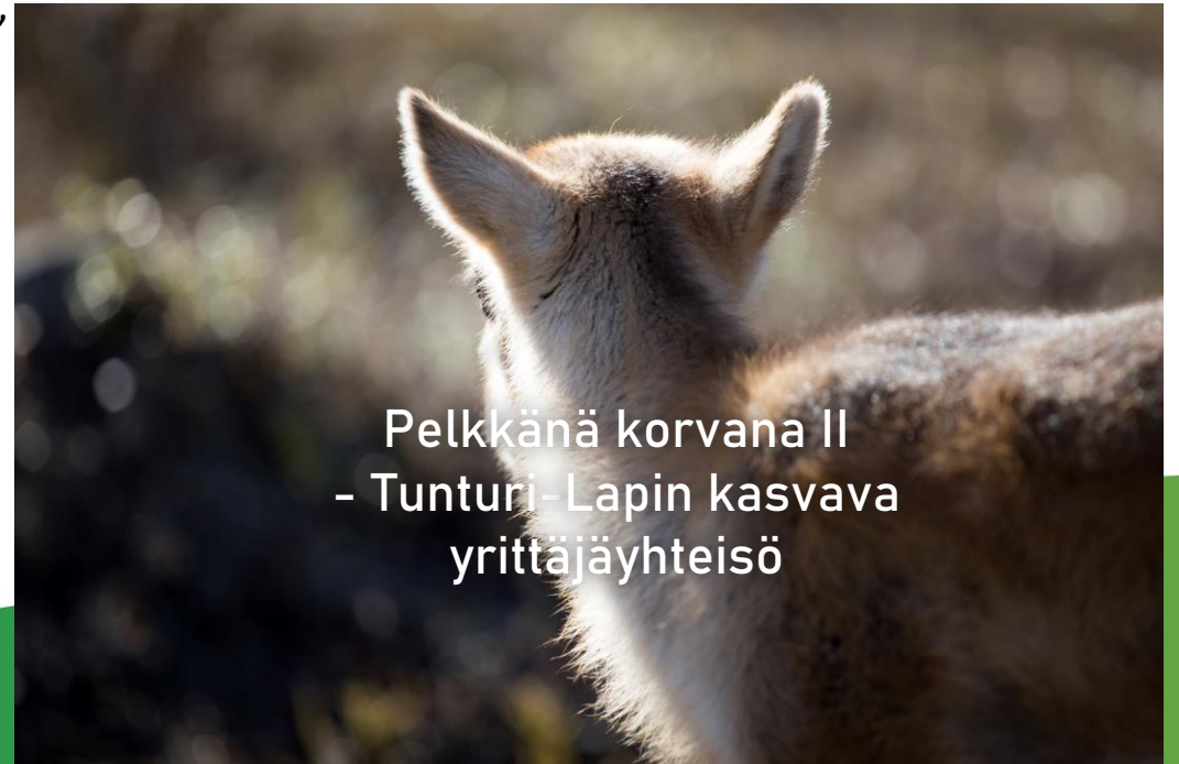
Pelkkänä korvana II - Tunturi-Lapin kasvava yrittäjäyhteisö